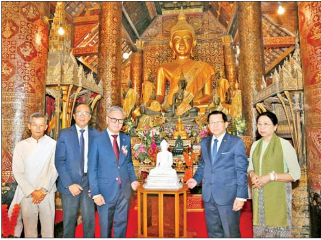
ဇူလိုင် ၅ ရက်က နိုင်ငံတော်သမ္မတ ဦးမင်းအောင်လှိုင်နှင့်ဇနီး ဒေါ်ကြာကြာလှ လွန်ပရာဘန်မြို့ ဝပ်စီယမ်သုန်ဘုရားကျောင်းအတွင်း အများပြည်သူဖူးမြော်နိုင်ရန်အတွက် မာရဝိဇယဗုဒ္ဓရုပ်ပွားတော်မြတ်တစ်ဆူနှင့် မာရဝိဇယဘုရားကြီးတည်ဆောက်ခဲ့မှု သမိုင်းမှတ်တမ်းစာအုပ်ကို လှူဒါန်းစဉ်။

ထို့နောက် နိုင်ငံတော်သမ္မတနှင့်ဇနီးတို့သည် လွန်ပရာဘန်မြို့ရှိ သမိုင်းဝင် “ဝပ်စီယမ်သုန်” (Wat Xieng Thong) ဘုရားကျောင်းရှိ ဗုဒ္ဓရုပ်ပွားတော်မြတ်အား သွားရောက်ဖူးမြော်ကြည့်ညိုကြပြီး ဘုရားကျောင်းအတွင်း အများပြည်သူ ဖူးမြော်ကြည့်ညိုနိုင်ရန် မာရဝိဇယဗုဒ္ဓရုပ်ပွားတော်မြတ်တစ်ဆူနှင့် ရုပ်ပွားတော်နှင့် ဘုရားတည်ဆောက်မှု သမိုင်းမှတ်တမ်းစာအုပ်ကို ပေးအပ်လှူဒါန်းခဲ့သည်။ အဆိုပါ ဝပ်စီယမ်သုန်ဘုရားကို ၁၆ ရာစုနှစ်အတွင်း ဘုရင် Saya Setthathirath လက်ထက်တွင် တည်ဆောက်ခဲ့ပြီး ၁၅၆၀ ပြည့်နှစ်တွင် တည်ဆောက်မှုပြီးစီးခဲ့သည်။ အဆိုပါဘုရားကျောင်းသည် လာအိုနိုင်ငံ၏ ရိုးရာလက်ရာများနှင့်ဗိသုကာလက်ရာများအနက် စိတ်ဝင်စားဖွယ်ကောင်းသည့် ဘုရားကျောင်းတစ်ခုဖြစ်သည်။ မှန်စံရွှေချာဝသပင်ပန်းချီကားနှင့် သိမ်တော်အဆောက်အအုံ၏ ခေါင်းမိုးဗိသုကာလက်ရာများမှာ ထင်ရှားသည်။ လွန်ပရာဘန်ပြည်နယ်သို့ ရောက်ရှိခဲ့လျှင် ဝပ်စီယမ်သုန်ဘုရားကျောင်းသို့ သွားရောက်ဖူးမြော်ပါက ကိုယ်စိတ်နှစ်ဖြာ ကျန်းမာချမ်းသာ အောင်မြင်မှုများရရှိသည်ဟု ယုံကြည်သက်ဝင်ကြသည်။ အာရုံတိုက်၏ အလှဆုံး ဘုရားကျောင်းအဖြစ် ကမ္ဘာလှည့်ခရီးသည်များ လာရောက်လေ့လာလည်ပတ်ကြသည်။