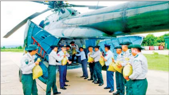
နေပြည်တော် တပ်ကုန်းမြို့နယ်အတွင်း ကြံချစိုက်ပျိုးမည့် သစ်စေ့မြေလုံးများကို တာဝန်ရှိသူများက ရဟတ်ယာဉ်ပေါ်သို့ တင်ဆောင်စဉ်။

နေပြည်တော် ဇူလိုင် ၆ သယံဇာတနှင့် သဘာဝပတ်ဝန်းကျင်ထိန်းသိမ်းရေးဝန်ကြီးဌာနနှင့် တာကွယ်ရေးဦးစီးချုပ်ရုံး(လေ)တို့၏ ပူးပေါင်းစီစဉ်မှုဖြင့် ပြည်ထောင်စုနယ်မြေ နေပြည်တော်တပ်ကုန်းမြို့နယ် ဆင်သေချောင်းရေဝေရေလဲစရိယာအတွင်းရှိ လွတ်ကြီးပိုင်းအတွင်းနှင့် ရှမ်းပြည်နယ် ညောင်ရွှေမြို့နယ် အင်းလေကန် ရေဝေရေလဲစရိယာအတွင်းရှိ အင်းလေးအနောက်ကြီးပြင်ကာကွယ်တောတို့အတွင်းရှိ တောနိမ့်တောပါး၊ ကွက်လပ်ဖြစ်ပေါ်နေသော တောင်ကုန်းများတွင် တပ်မတော်ရဟတ်ယာဉ်ဖြင့် သစ်စေ့မြေလုံးများ ကြံချခြင်းကို ပြုလုပ်ခဲ့သည်။ စာမျက်နှာ ၃ ကော်လံ ၁ သို့ ○