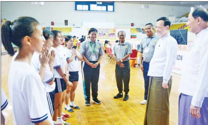
တာဝန်ရှိသူများနှင့် အားကစား ပြိုင်ပွဲ ဗိုလ်လုပွဲ ပွဲစဉ်အဖြစ် ပညာရေးဝန်ကြီးဌာန အသင်းနှင့် ကြည့်ရှုအားပေးခဲ့ကြောင်း သိရ Linking Event - 3 (အမျိုးသမီး) ဆောက်လုပ်ရေး ဝန်ကြီးဌာန သတင်းစဉ်

၂၀၂၆ ခုနှစ် ဝန်ကြီးဌာနပေါင်းစုံ ရုံးရာခြင်းလုံးပြိုင်ပွဲ (ဆန္ဒမနေ့) ကို နေပြည်တော် ဝတ္ထုသိပ္ပံအားကစားရုံ (A) ၌ ဆက်လက်ကျင်းပလျက် ရှိရာ ပညာရေးဝန်ကြီးဌာန ဒုတိယဝန်ကြီး ဒေါက်တာဇော်မြင့်သည် ယနေ့ဗိုလ်လုပွဲ ပွဲစဉ် ယှဉ်ပြိုင်ကစားမည့် ပညာရေးဝန်ကြီးဌာန အမျိုးသမီးအသင်းအား တွေ့ဆုံ အားပေးစကားပြောကြားသည်။