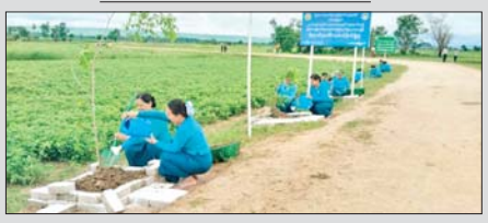
ပြည်ထောင်စုနယ်မြေ နေပြည်တော် တပ်ကုန်းမြို့နယ်၌ ရှားတော ကျေးရွာနှင့် ငွေပင်ကျေးရွာ ကျေးရွာချင်းဆက်လမ်းတွင် တပ်ကုန်း မြို့နယ် စီမံခန့်ခွဲရေးနှင့် အုပ်ချုပ်ရေးကော်မတီအဖွဲ့ဝင်များ၊ မြို့နယ် အမျိုးသမီးရေးရာအဖွဲ့ဝင်များက ဇူလိုင် ၃ ရက်တွင် ပျိုးပင်ပေါင်း ၅၀၀ တို့ကို စုပေါင်းစိုက်ပျိုးကြစဉ်။ တင်စိုးလွင်