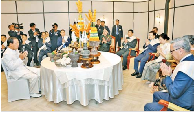
ဇူလိုင် ၅ ရက်က နိုင်ငံတော်သမ္မတ ဦးမင်းအောင်လှိုင်နှင့် ဇနီး ဒေါ်ကြာကြာလှတို့ လာအိုရိုးရာဆုတောင်းပွဲအခမ်းအနား (တာစီပွဲတော်)သို့ တက်ရောက်ပြီး လာအိုရိုးရာစဉ်အလာဖြင့် ဆုမွန်ကောင်းများတောင်းကြစဉ်။

ပူးပေါင်းဆောင်ရွက် နှစ်နိုင်ငံ ချစ်ကြည်ရင်းနှီးမှု၊ ကဏ္ဍပေါင်းစုံ ပူးပေါင်းဆောင်ရွက်မှုများတွင် အထူးသဖြင့် နိုင်ငံတော်သမ္မတကြီး လမ်းညွှန်ထားသည့် “စွမ်းအင် လုံခြုံမှုသည် နိုင်ငံဖွံ့ဖြိုးတိုးတက်မှုအတွက် အခြေခံအကျဆုံးဖြစ်သည်” ဆိုသည့်အချက်ကို အလေးထား၍ မြန်မာ-လာအို လျှပ်စစ်ဓာတ်အားထုတ်လုပ်ရေးအတွက် ကနဦးစမ်းသပ်မှုများပြုလုပ်ပြီး အကောင်အထည်ဖော်နိုင်မည့် အခွင့်အလမ်းရရှိခဲ့သည်။