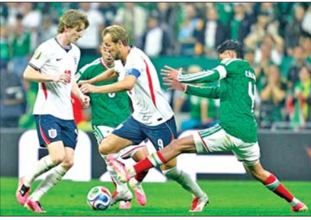
မဏ္ဍဆီကိုအသင်းနှင့် အင်္ဂလန်အသင်းတို့ ယှဉ်ပြိုင်နေစဉ်။

အင်္ဂလန်အသင်းနဲ့ နော်ဝေအသင်းတို့ဟာ ကမ္ဘာ့ဖလားပြိုင်ပွဲရဲ့ (၁၆)သင်းအဆင့်ပွဲစဉ်မှာ နိုင်ပွဲကိုယ်စီရရှိပြီး ကမ္ဘာ့ဖလားကွာတားဖိုင်နယ်အဆင့်ကို တက်လှမ်းခွင့်ရရှိခဲ့ပြီဖြစ်ပါတယ်။