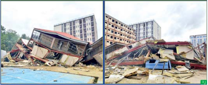
ကရင်ပြည်နယ် မြဝတီခရိုင် ရွှေကုက္ကိုလ်နယ်မြေရှိ အွန်လိုင်းလိမ်လည်လောင်းကစားမှုလုပ်ကိုင်ခဲ့ သည့် တရားမဝင် ကိုးထပ်အဆောက်အအုံအား ယမ်းဖြင့် ဖောက်ခွဲဖျက်ဆီးပြီးနောက် တွေ့ရစဉ်။

လုပ်ငန်းများ ကျူးလွန်ရာတွင် အသုံးပြုခဲ့သည့် အဆောက်အအုံ ၇၇ လုံးအနက် ယာဉ်ယန္တရားများ ဖြင့် ဖြိုချဖျက်ဆီးမည့် အဆောက် အအုံ ၅၇ လုံးနှင့် ဖောက်ခွဲ၍ ဖျက်ဆီးမည့် အဆောက်အအုံ အလုံး ၂၀ ဟူ၍ အဆောက်အအုံ အမျိုးအစားအလိုက် ခွဲခြား သတ်မှတ်ပြီး စနစ်တကျဖြိုချ ဖျက်ဆီးလျက်ရှိရာ ယနေ့တွင်