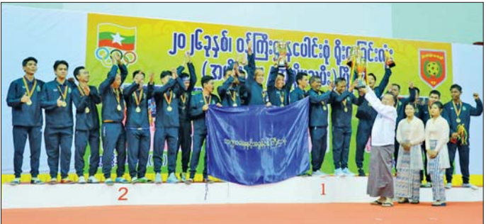
ဘဏ္ဍာရေးနှင့်အခွန်ဝန်ကြီးဌာနအသင်းအား အမျိုးသားတံခွန်စိုက်ဆုဖလား ပေးအပ်ချီးမြှင့်စဉ်။

အခမ်းအနားသို့ မြန်မာနိုင်ငံ အိုလံပစ်ကော်မတီ ဥက္ကဋ္ဌ အားကစားရေးရာ ဝန်ကြီးဌာန ပြည်ထောင်စုဝန်ကြီး ဦးရဲမြင့်ထွန်း၊ ပြည်ထောင်စုဝန်ကြီး ဒေါက်တာကံဇော်၊ ဦးသန်းမောင်၊ ဒေါက်တာသက်သက်ဇင်၊ ဦးတင်ဦးလွင်၊ ဒေါက်တာမောင်သင်းနှင့် ဒေါက်တာစိုးဝင်း၊ ပြည်ထောင်စုစာရင်းစစ်ချုပ် ဒေါ်နိုင်သက်ဦး၊ ဒုတိယဝန်ကြီးများ၊ မြန်မာနိုင်ငံ ရိုးရာခြင်းလုံးအဖွဲ့ချုပ်မှ နာယက စာမျက်နှာ ၁၇ ကော်လံ ၁ သို့ *