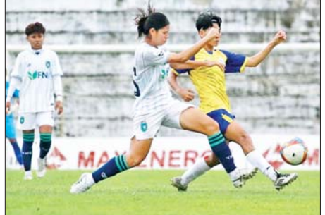
အား/ကာသိပ္ပံအသင်းနှင့် ရန်ကုန်ယူနိုက်တက်အသင်းတို့ ယှဉ်ပြိုင်နေစဉ်။

ရန်ကုန် ဇူလိုင် ၆ ၂၀၂၆-၂၀၂၇ ရာသီ မြန်မာအမျိုးသမီးလိဂ်ပြိုင်ပွဲ ပွဲစဉ်(၄)ပထမနေ့ ကို ဇူလိုင် ၆ ရက်က ဆက်လက်ကျင်းပရာ အား/ကာသိပ္ပံအသင်းနှင့် ရှမ်းယူနိုက်တက်အသင်းတို့ နိုင်ပွဲဆက်ခဲ့သည်။ ပုဒ္မားကွင်း၌ ကျင်းပသည့်ပွဲတွင် အား/ကာသိပ္ပံအသင်းက ရန်ကုန်ယူနိုက်တက်အသင်းကို နှစ်ဂိုး-ဂိုးမှီရရှိပြီး အနိုင်ရခဲ့သည်။ ရာသီအစ သုံးပွဲဆက်တိုက်အနိုင်ရရှိပြီး ထိပ်ဆုံးတွင် အပြိုင်ဖြစ်နေသည့် နှစ်သင်း တွေ့ဆုံခြင်းဖြစ်ပြီး အား/ကာသိပ္ပံအသင်းက လေးပွဲဆက်အနိုင်ရလဒ် နှင့်အတူ ဇယားထိပ်ဆုံးတွင် အမှတ်ဖြတ် ဦးဆောင်နိုင်ခဲ့သည်။ အား/ကာသိပ္ပံအသင်းသည် ယခုရာသီတွင် ချန်ပီယံဆုအတွက် အပြိုင်ဖြစ်လာနိုင်သည့် ဧရာဝတီအသင်းနှင့် ရန်ကုန်ယူနိုက်တက်အသင်းတို့ကို ဆက်တိုက် အနိုင်ကစားခဲ့ခြင်းဖြစ်သည်။ အား/ကာသိပ္ပံအသင်းအတွက် အနိုင်ရိုးများကို ၁၅ မိနစ်တွင် လင်းမြင့်စိုရီ စာမျက်နှာ ၁၇ ကော်လံ ၁ သို့ ◆