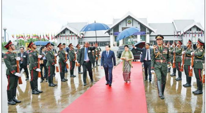
နိုင်ငံတော်သမ္မတ ဦးမင်းအောင်လှိုင်နှင့် ဇနီး ဒေါ်ကြူကြူလှတို့ ဇူလိုင် ၅ ရက်က ဗီယက်ကျန်းမြို့မှ လွန်ပရာဘန်မြို့သို့ထွက်ခွာရာ ဝပ်တိုင်းအပြည်ပြည်ဆိုင်ရာလေဆိပ်၌ လာအိုပြည်သူ့ဒီမိုကရက်တစ် သမ္မတနိုင်ငံမှ တာဝန်ရှိသူများနှင့် ဂုဏ်ပြုတံပွဲတို့က ပို့ဆောင်နှုတ်ဆက်ကြစဉ်။

Fa Ngum အား လက်ဆောင်အဖြစ် ပေးအပ်ခဲ့ခြင်း ဖြစ်သည်။ အဆိုပါဘုရားကျောင်းတော်ကို ၁၉၆၃ ခုနှစ် တွင် စတင်တည်ဆောက်ခဲ့ပြီး ပြည်တွင်းစစ်ကြောင့် ၁၉၉၀ ပြည့်နှစ်မှ ဆောက်လုပ်ရေးလုပ်ငန်းများ ပြန်လည်စတင်ခဲ့ကာ ၂၀၀၆ ခုနှစ်တွင် တရားဝင် ဖွင့်လှစ်ခဲ့ကြောင်း သိရသည်။ တော်ဝင်နန်းတော် ပြတိုက်သည် မဲခေါင်မြစ်ကမ်းပါးပေါ်တွင် တည်ရှိပြီး လာအိုနိုင်ငံ၏ အမြင့်မြတ်ဆုံးနေရာအဖြစ် ထိန်းသိမ်း ထားရှိသည်။ ယခင်က ကျွန်းသစ်များဖြင့်သာ ဆောက်လုပ်ထားခြင်းဖြစ်ပြီး ပြန်လည်ပြုပြင်သည့် အခါ ပြင်သစ်လက်ရာများနှင့် လာအိုမိသကလာလက်ရာ များရောနှောကာ အုတ်ဖြင့်အစားထိုးတည်ဆောက် ခဲ့သည်။ ၁၉၇၅ ခုနှစ်တွင် လာအိုအာဏာရှင်လာအိုနီတွင် ဘုရင်စနစ်ကို ဖျက်သိမ်းပြီး တော်ဝင်မိသားစုတို့ နန်းအိုင်အုတ်ခွာခဲ့ရသည်။ ၁၉၉၅ ခုနှစ်တွင် ယူနက် စကိုအဖွဲ့ကြီးက လွန်ပရာဘန်မြို့တစ်ခုလုံးကို ကမ္ဘာ့ အမွေအနှစ်မြို့အဖြစ် တရားဝင်သတ်မှတ်ခဲ့သည်။