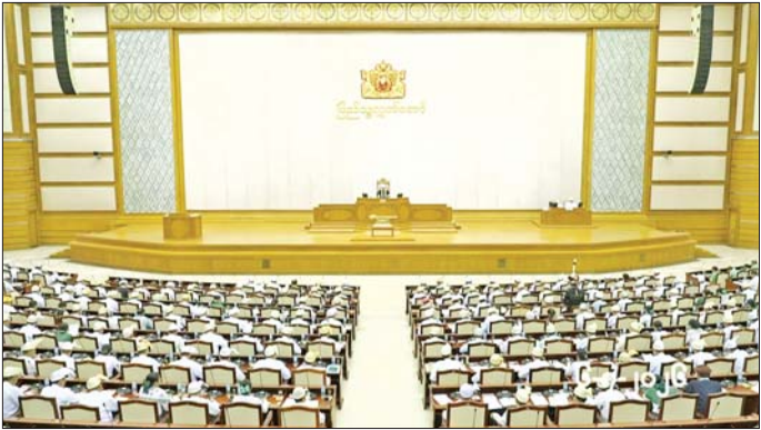
တတိယအကြိမ် ပြည်သူ့လွှတ်တော် ဒုတိယပုံမှန်အစည်းအဝေး ၁၉ ရက်မြောက်နေ့ ကျင်းပစဉ်။

နေပြည်တော် ဇူလိုင် ၆ တတိယအကြိမ် ပြည်သူ့လွှတ်တော် ဒုတိယပုံမှန်အစည်းအဝေး ၁၉ ရက်မြောက်နေ့ကို ယနေ့ ဖွန်းလွှဲ ၁ နာရီခွဲတွင် နေပြည်တော်ရှိ လွှတ်တော်အဆောက်အအုံ ပြည်သူ့လွှတ်တော် အစည်းအဝေးခန်းမ၌ ကျင်းပရာ ပြည်သူ့လွှတ်တော်ဥက္ကဋ္ဌ ဦးခင်ရီ၊ ဒုတိယဥက္ကဋ္ဌ ဦးမောင်မောင်အုန်းနှင့် ပြည်သူ့လွှတ်တော်ကိုယ်စားလှယ်များ တက်ရောက်ကြသည်။ အစည်းအဝေးတွင် တရားသူကြီးနှင့် ရှေ့နေများ လိုက်နာရမည့် Code of Conduct ကျင့်ဝတ်နိတိများ ပညာပေးရေး၊ လမ်းအဆင့်မြှင့်တင်ပေးနိုင်ရေး၊ မြို့တော်ခန်းမတစ်ခုနှင့် ဘောလုံးကွင်း တစ်ကွင်း တည်ဆောက်ပေးနိုင်ရေး၊ မြို့ပြဖွံ့ဖြိုးရေးစီမံချက် ရေးဆွဲဆောင်ရွက်ပေးနိုင်ရေး၊ စနစ်ကျသော စာမျက်နှာ ၄ ကော်လံ ၁ သို့ ▢