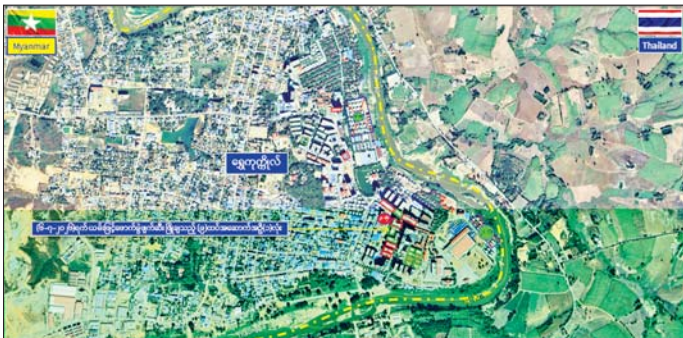
ကရင်ပြည်နယ် မြဝတီမြို့နယ် ရွှေကုက္ကိုလ်နယ်မြေရှိ အွန်လိုင်းလိမ်လည်လောင်းကစားမှုများ လုပ်ကိုင်ခဲ့သည့် တရားမဝင်အဆောက်အအုံအား ဖောက်ခွဲဖျက်ဆီးမှုကို တွေ့ရစဉ်။

နေပြည်တော် ဇူလိုင် ၆ အွန်လိုင်း လိမ်လည်လောင်းကစားမှုများကို အခြေချ လုပ်ကိုင်ခဲ့ကြသည့် ကရင်ပြည်နယ် မြဝတီမြို့နယ် ရွှေကုက္ကိုလ်နယ်မြေနှင့် KK Park နယ်မြေများ ရှိတရားမဝင်အဆောက်အအုံများ အား အပြီးတိုင်ဖြိုချဖျက်ဆီးခြင်း များနှင့် လုပ်ငန်းလုပ်ဆောင်ရာ တွင် အသုံးပြုခဲ့သည့် ပစ္စည်းများ အား စနစ်တကျဖျက်ဆီးခြင်းများ ကို ဌာနဆိုင်ရာပူးပေါင်းအဖွဲ့များ ဖြင့် ဆောင်ရွက်လျက်ရှိရာ ယနေ့ တွင် ရွှေကုက္ကိုလ်နယ်မြေအတွင်းရှိ တရားမဝင် ကိုးထပ်အဆောက် အအုံတစ်လုံးကို ထပ်မံ၍ စနစ် တကျ ဖောက်ခွဲဖျက်ဆီးခဲ့ ပြောင်း သိရသည်။ ရွှေကုက္ကိုလ်နယ်မြေအတွင်း၌ အွန်လိုင်းလိမ်လည်လောင်းကစား