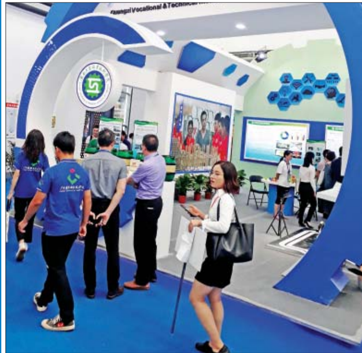
အသက်မွေးဝမ်းကျောင်းသိပ္ပံပြခန်း

ဦးနှင့်အတူ) သင်ကြားပေးလျက်ရှိပါသည်။ နောက်တစ်ရက်တွင်မူ ကွမ်ရှီးဆောက်လုပ်ရေး အသက်မွေးမှုဆိုင်ရာသိပ္ပံကောလိပ်/ကျောင်းခန်းမကြီး (Guangxi Polytechnic of Construction - Aachitorium) တွင် တက်ရောက်သူဦးရေပေါင်း ၁၀၀၀ ကျော်ခန့်ဖြင့် စည်ကားစွာ ကျင်းပပါ